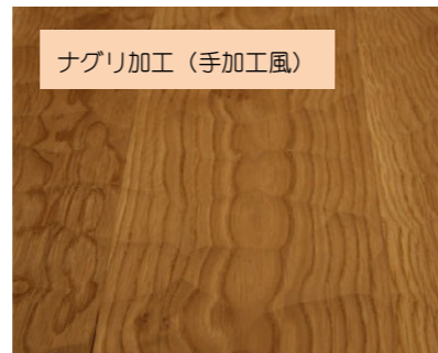
ナグリ加工(手加工風)