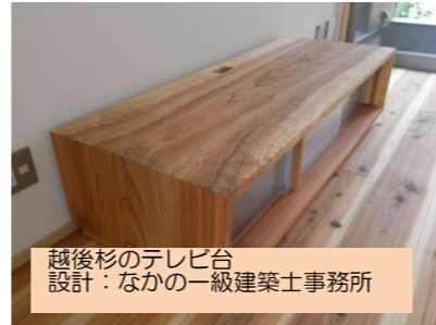
越後杉のテレビ台 設計: なかの一級建築士事務所

さて、元々越後の杉があまり評価されずに、他県の杉が喜ばれていたのは、豪雪地帯の杉は雪の圧力を受けて曲がりの出るものが多かった事と、太った杉が少なかった事からだと思われます。“色が悪い”という意見もありましたが、そんなことはありません。木童でも、何度か使っていますが、赤身が強く、目の込んだ美しい材でした。もちろん、杉は地域差以上に個体差があるので、良い材を選んで貰ったのでしょう。