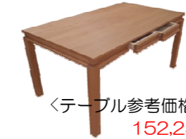
<テーブル参考価格> 152,250円

*対象となるテーブルの種類、大きさは問いません。オーダー品でもOKです。(左写真は組み合わせ参考例)