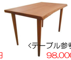
<テーブル参考価格> 98,000円

*プレゼントの椅子は「KOMACHAIR」「KOMACHAIR」現品になります。 *椅子の梱包・送料は別途となります。