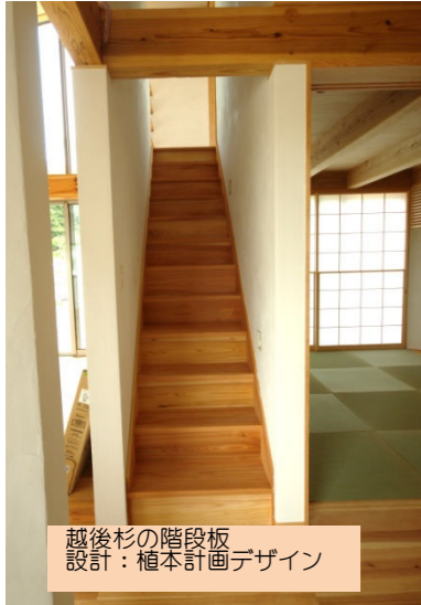
越後杉の階段板 設計: 植本計画デザイン

最近新潟県に行くと、「えちご杉」というあまり馴染みのない杉の名前を耳にします。20年ほど前、よく新潟県を訪れていた頃には、県内の材木商の方から、「杉は山形から買っている」と聞いていたので、正直な感想は「へ～、頑張りだしたんだ」というところでした。宮崎県のオビ杉や長野県の信州ブランド材のように、県外・首都圏に対しての販売促進はまだまだのようですが、県内の住宅や公共事業には積極的に推進しているようです。(越後の杉は成長が遅いため、戦後植林した杉がここに来てやっと使えるような太さに育ってきました。)