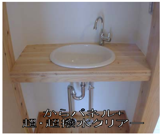
からパネル+ 超・超撥水クリアー

※1桐油、亜麻仁油、荳胡麻油、紅花油、米糠油等の乾性油 (植物油の中でも比較的乾燥し易い油) が主です。