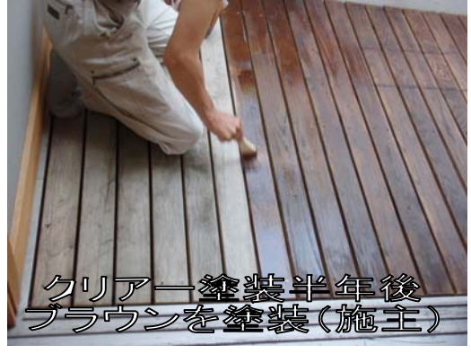
クリアー塗装半年後 ブラウンを塗装(施主)