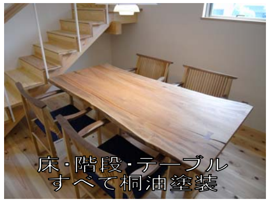
床・階段・テーブル すべて桐油塗装

自然塗料の多くは※1植物油を主成分としており、木童の桐油も桐の種を絞った桐油を主成分としていますので、他の自然塗料もおおむねメンテナンスは同じとお考えいただいても良いでしょう。 また、初回の塗装方法については、カタログの裏表紙に記載しておりますので、そちらを参照ください。